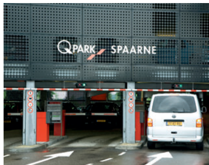
02 Lochblechelemente der Außenfassade über der Parkhauseinfahrt

Partial view of the parking garage and helical ramp