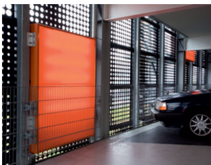
04 Blick von innen auf Lochbleche und Beleuchtungskörper „oranje“

Perforated panels with different hole sizes in each element, partly illuminated by the Dutch „oranje“