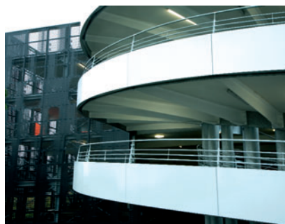
05 Wendelrampe mit Verkleidung

View from the inside to the perforated panels and to the lighting fixture „oranje“