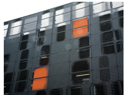
03 Lochblechelemente mit verschiedenen Lochdurchmessern pro Element, teilweise hinterleuchtet in holländischem „oranje“.

Perforated panels of the façade above the entrance area of the parking garage