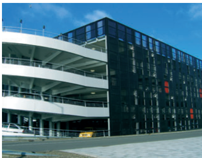
01 Teilansicht Parkhaus mit Wendelrampe

Coating sheets helical ramps: 130 panels of AlMg 3 2 mm lasercut, radiused and bended next to rivet down stiffening sheet all powder coated RAL 9006 (whitealuminium)