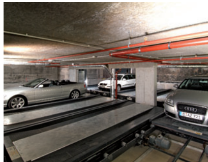
11 Ein Verschiebeakt dauert ca. 28 Sek.