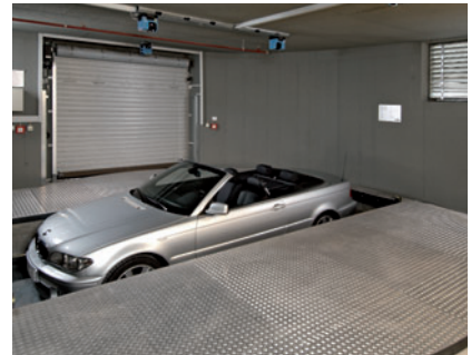
06 und abgesenkt.

As the transfer area is positioned at an angle of 90° towards the parking level the car is turned for 90° before reaching the parking level