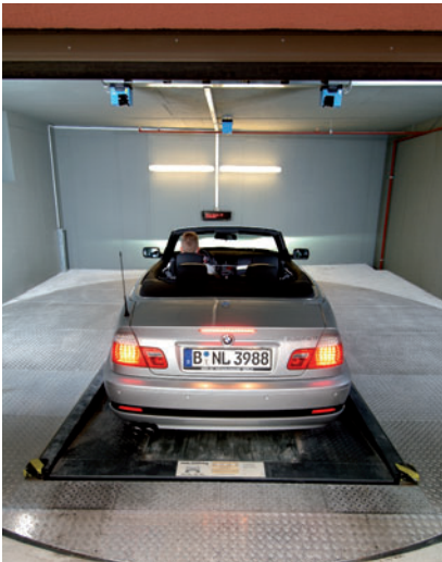
04 Laserscanner an der Garagendecke prüfen die richtige Parkposition des Pkw.

There is only one transfer area on courtyard level necessary from where the car is transported by means of a vertical lift into the parking level. The movements are cycled by longitudinal and lateral shiftings, requiring two empty places within the system.