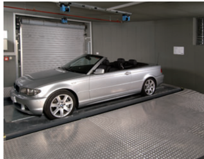
05 Da sich der Übergabebereich im 90° Winkel zur unterirdischen Parkebene befindet wird das Fahrzeug vor dem Einlagern um 90° gedreht

Laserscanners at the ceiling of the transfer area check the correct positioning of the car.